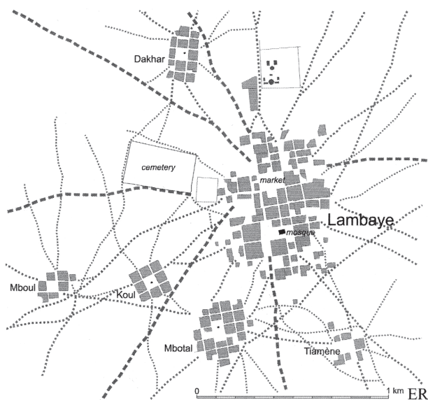
Ryc. 2. Plan miasta królewskiego Lambaye

W wieku XVII istotną rolę w życiu społeczności zamieszkującej Senegambię zaczęli odgrywać mużułmańscy duchowni. Często byli powiązani z dworami królewskimi,