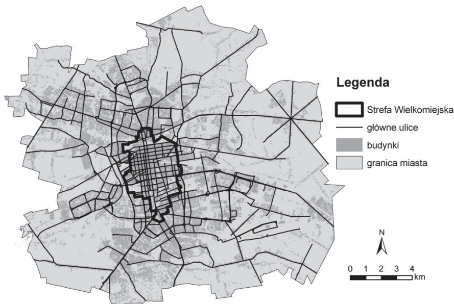
Rys. 1. Położenie Strefy Wielkomięjskiej w Łodzi