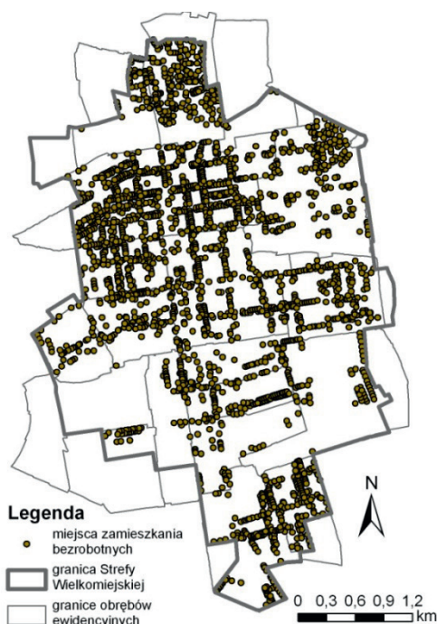
Rys. 2. Miejsca zamieszkania bezrobotnych w Strefie Wielkomięskiej w Łodzi w 2010 r.

50. roku życia, bez doświadczenia zawodowego, samotnie wychowujący dziecko do 18. roku życia, bezrobotny do 25. roku życia, bezrobotny niepełnosprawny, kobieta po urodzeniu dziecka, po odbyciu kary pozbawienia wolności, na stażu, na szkoleniu. Na podstawie danych adresowych dokonano ich geolokalizacji, a obszar obejmujący Strefę Wielkomięską przedstawiono na rysunku 2.