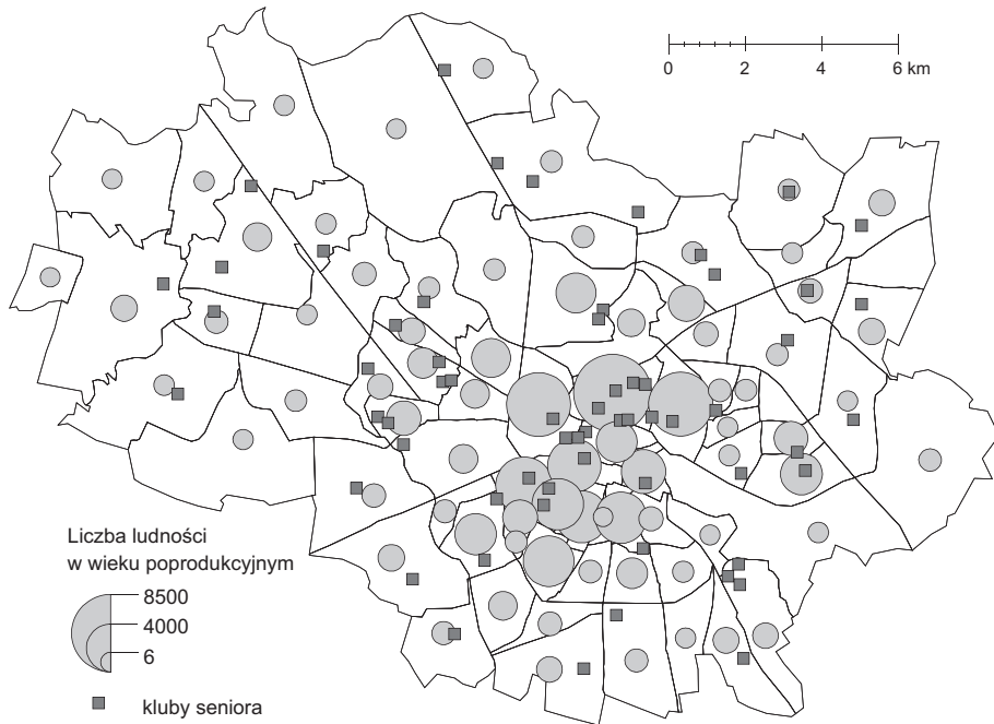
Rys. 1. Ludność w wieku poprodukcyjnym a rozmieszczenie klubów seniora we Wrocławiu w 2014 r.